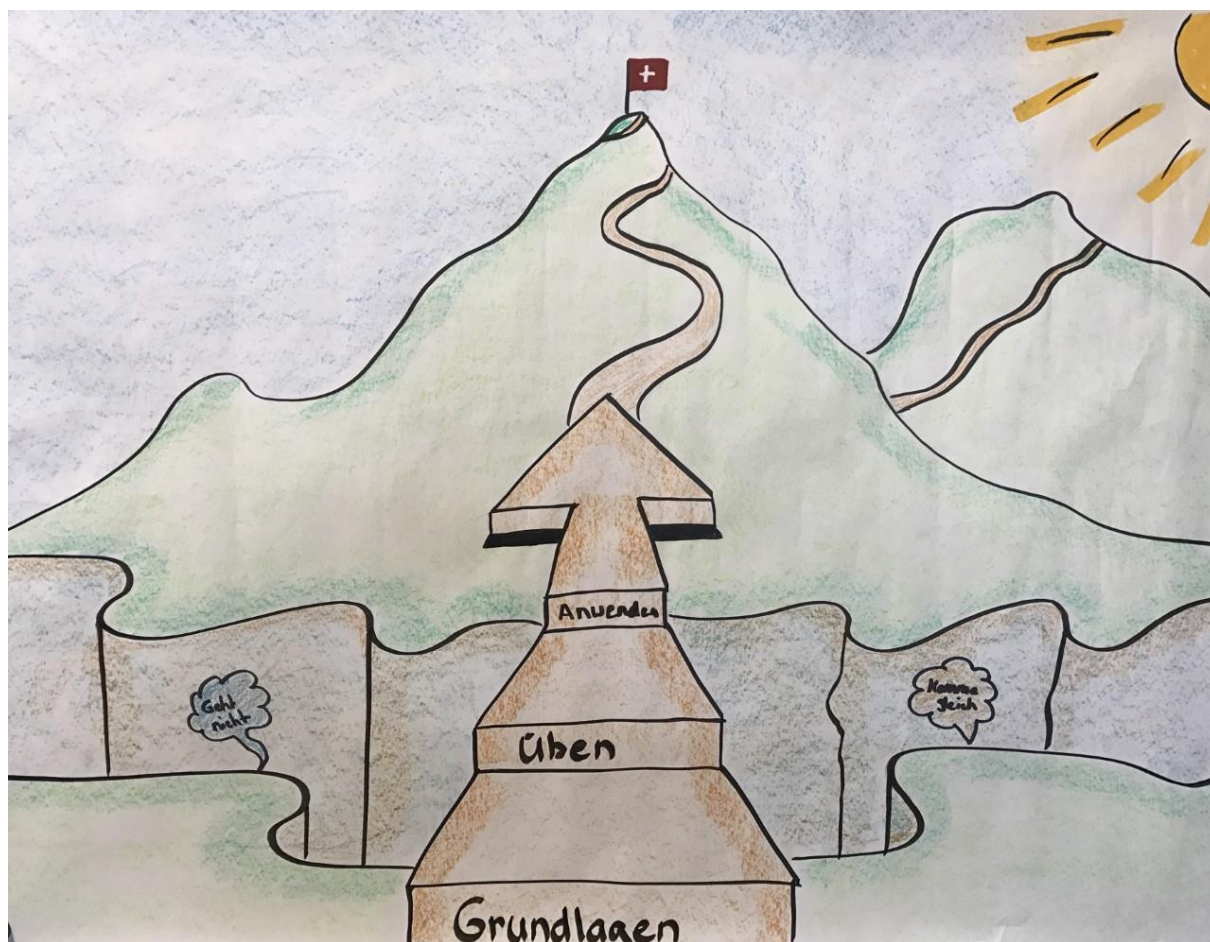
Zielplakat einer Übung der Absturzsicherungsgruppe von Luki Richli