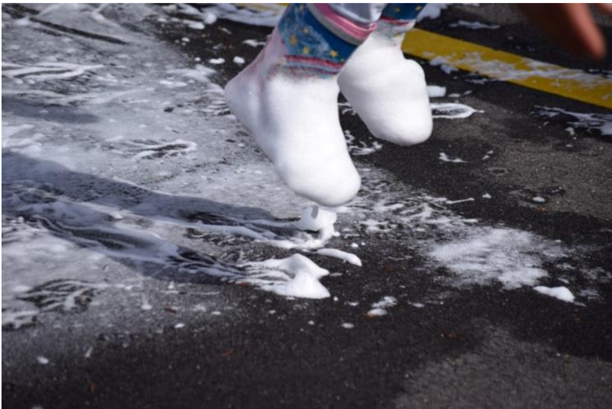
Posten Feuerlöscher am Kindergartentag 2017