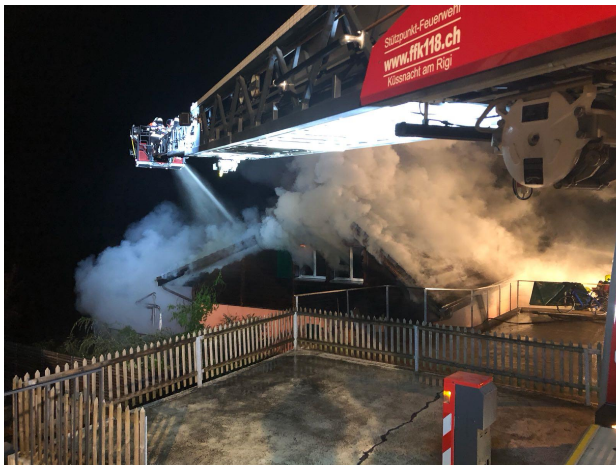
Einsatz als Stützpunkt Feuerwehr in Udligenswil 2018