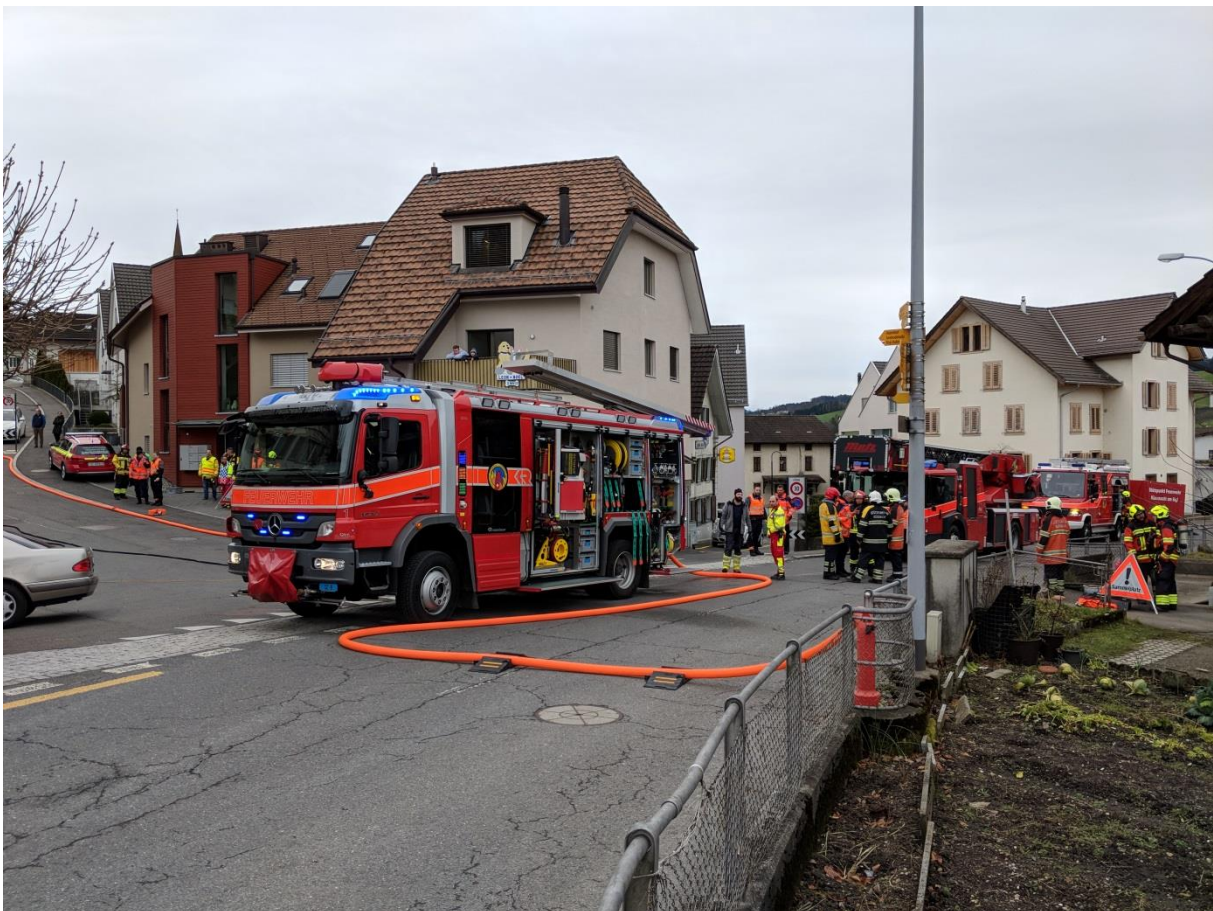
Brandeinsatz an der Hofstrasse 2017